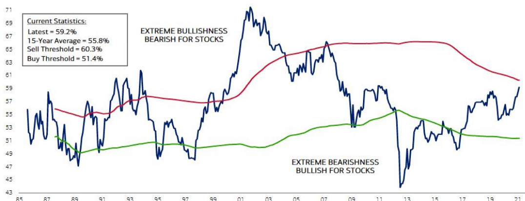
Exhibit 1: Sell Side Indicator just ~1ppt away from a "Sell" signal (as of 2/28/21)

Note: Buy and Sell signals are based on rolling 15-year +/- 1 standard deviation from the rolling 15-year mean. A reading above the red line indicates a Sell signal and a reading below the green line indicates a Buy signal